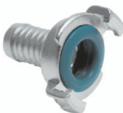
GK 25 TRN SS kód 32521

Poznámka: Kupínání doporučujeme spony ASFA nebo GBS.