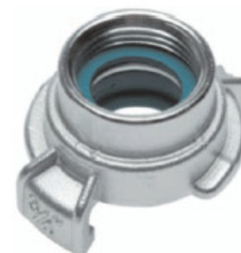
GK 25 IG SS kód 32522