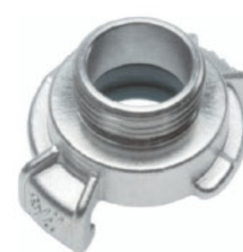
GK 25 AG SS kód 32523